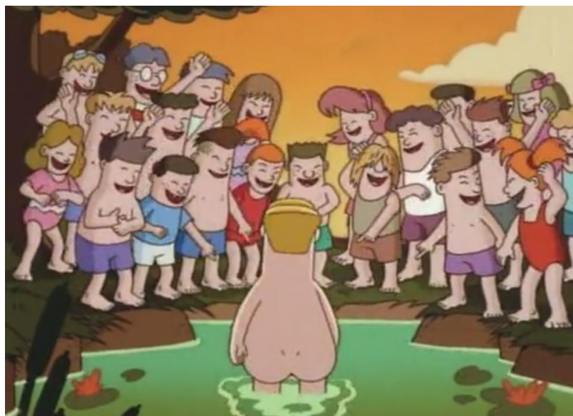
Figura 9 – Situação traumático na infância do vice-presidente [Dailymotion – Dilbert – S01E01 – The Name 8 ]

Manter o significado entre a palavra e o logotipo ocasionaria a perda da comicidade do apelido Acorn que iria aparecer mais à frente no episódio. O vice-presidente da empresa, ao se lembrar da infância, conta para os participantes da reunião o evento em que perdeu o calção de banho dentro de um lago e, ao sair da água, sofreu com a zombaria das outras crianças, que viram suas partes íntimas, apelidando-o então de Acorn , um fato que o traumatizou desde então, conforme representado na Figura 9.