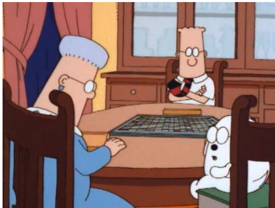
Figura 5 – Dilbert, Dogbert e Dilmom jogando Scrabble [Dailymotion – Dilbert – S01E01 – The Name 4 ]

Além dos desafios mencionados acima, o uso de neologismos no desenho gerou discussão durante a tradução. Na primeira cena do episódio, de responsabilidade do Grupo 3, os personagens Dilbert, Dogbert e Dilmom brincam de Scrabble , um jogo de palavras cruzadas, cena ilustrada na Figura 5.