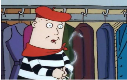
Figura 4 – Trecho da cena em que o dono da lavanderia ameaça Dilbert [Dailymotion – Dilbert – S01E01 – The Name 3 ]

A questão sobre a divergência cultural estava no termo campfire songs , que são músicas geralmente cantadas ao redor de fogueiras. Contudo, esta não é uma prática comum no país da língua-alvo. A solução encontrada foi: [...] QUE, EMBORA VELHO E FRACO, IRÁ TE BATER E CHICOTEAR SEM MISERICÓRDIA ATÉ QUE VOCÊ CANTE CANTIGAS DE RODA NA VOZ DE UMA GAROTINHA. A expressão "cantiga de roda" foi a opção utilizada pelos componentes do Grupo 4, eliminando assim a lacuna cultural ocasionada entre as línguas.