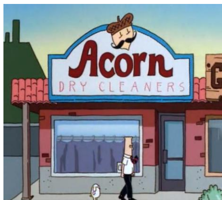
Figura 7 – Placa da lavanderia a seco Acorn [Dailymotion – Dilbert – S01E01 – The Name 6 ]

O logotipo da lavanderia Acorn era o desenho do fruto; por isso, afastar a tradução de uma opção que envolvesse alimentos oleaginosos, tais como nozes, castanhas, amêndoas poderia ocasionar a perda de significado entre o logotipo e a palavra. Além do logotipo com o desenho, os funcionários da empresa de Dilbert, ao decidirem nomear o produto como Acorn , criaram uma fantasia para vestirem e realizarem uma performance na reunião de apresentação do nome do produto. A Figura 7 ilustra o logotipo da lavanderia e a Figura 8, a fantasia de Acorn produzida para a reunião.