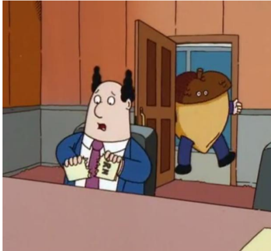
Figura 8 – Fantasia criada para a reunião de apresentação da marca [Dailymotion – Dilbert – S01E01 – The Name 7 ]

Manter o significado entre a palavra e o logotipo ocasionaria a perda da comicidade do apelido Acorn que iria aparecer mais à frente no episódio. O vice-presidente da empresa, ao se lembrar da infância, conta para os participantes da reunião o evento em que perdeu o calção de banho dentro de um lago e, ao sair da água, sofreu com a zombaria das outras crianças, que viram suas partes íntimas, apelidando-o então de Acorn , um fato que o traumatizou desde então, conforme representado na Figura 9.